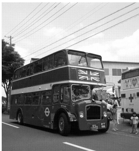
2階建てのバスが駐車場と会場をピストン運行し来場者を運びました

去る五月十八日(土)、磐田市合代島の「大工村」で、「第二回遠州大工職人まつり」が開催されました。昨年の第一回目もおよそ二千人の来場者で賑わいましたが、今回は昨年の出店数の約一・四倍の規模で、来場者もおよそ三千人とほぼ一・五倍に増えました。