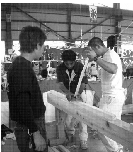
弊社社員も鉋の薄削り大会に参加

今年も昨年同様「鉋の薄削り大会」や「職人ファッションショー」、K・mixのラジオ番組の公開生放送などが行われた。献血車や地震体験車、色々な食べ物の屋台、マッサージまで出店していて、大勢の来場者を飽きさせませんでした。