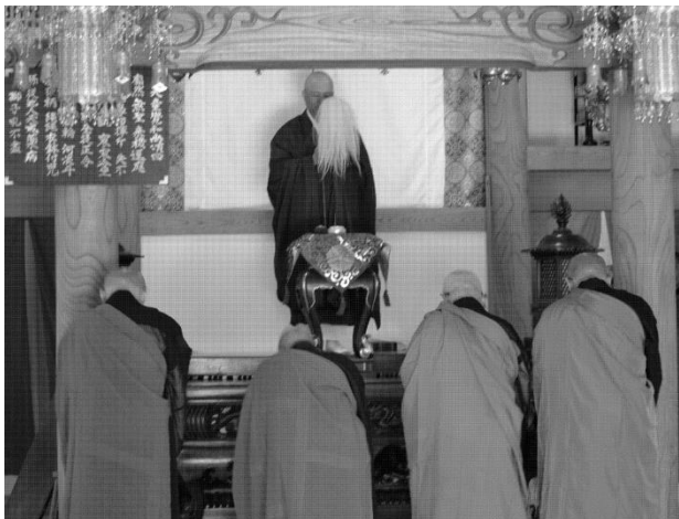
西光寺様の晋山結制式の様子

今後御寺門がますます発展されることをお祈りしつつ、末永いお付き合いをさせていただければと思っております。