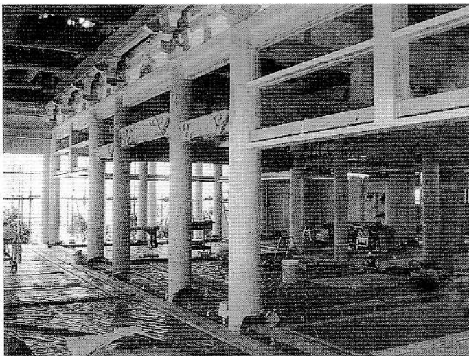
興徳寺様の本堂内部（平成23年2月）

新しい本堂の美しさを見ることができません。この本堂の特徴は「荘厳さの中に、柔らかさと美しさを表現する」をテーマに、県内または静岡県近隣の材木を多用しており、丸柱は全て直径一尺一寸（約三十三cm）以上の太さの材